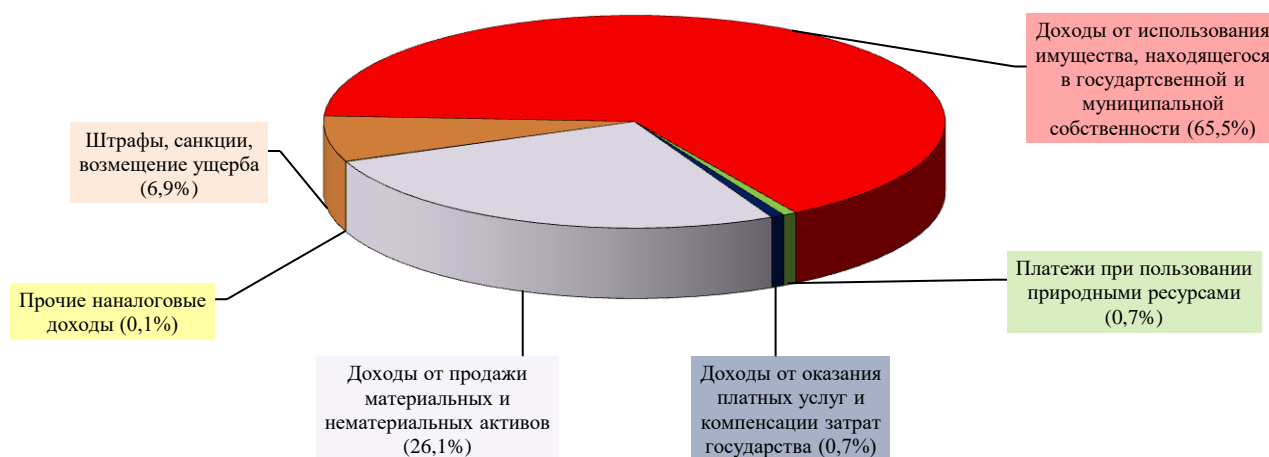
Уровень исполнения неналоговых доходов в 2022 году (в процентах от утвержденных бюджетных назначений)